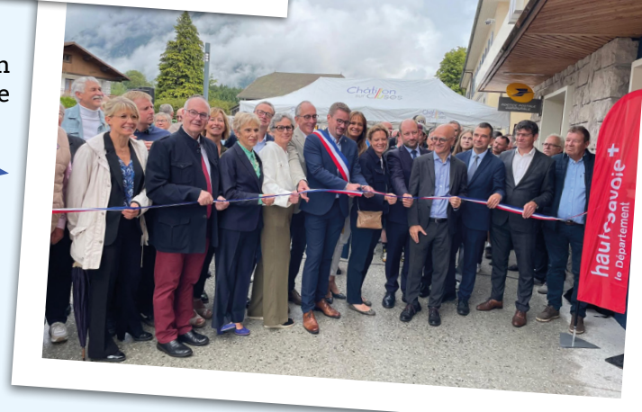
Inauguration de la mairie