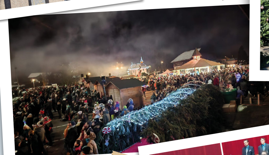
Marché de Noël La Ripaille Cassandrine