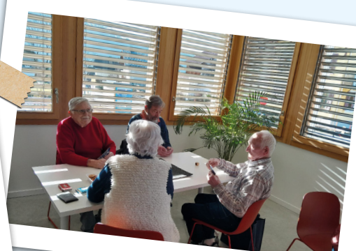
Groupe des joueurs de Belote du Mardi