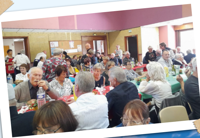
Repas dansant Chorale La Cassandrine