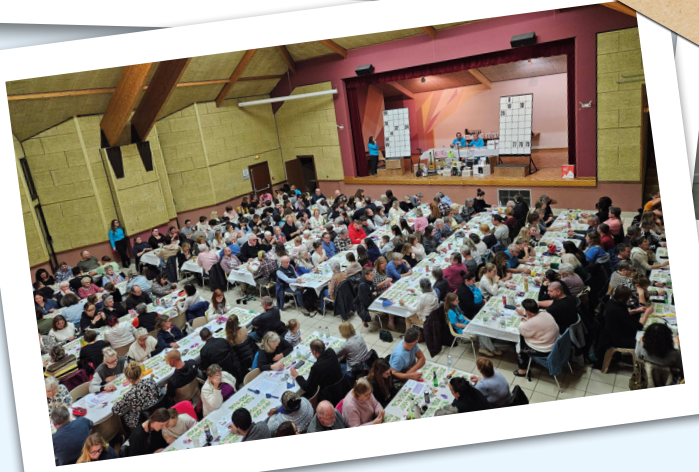
Loto de l'Harmonie Municipale