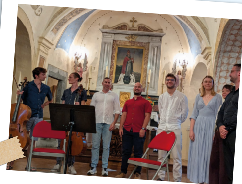
Représentation Festival lyrique