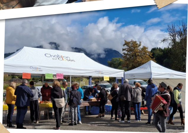
Fête d'Automne Vit' Anime C