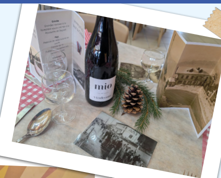
Repas des Sages