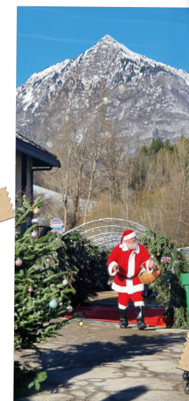
Notre Père Noël en visite sur le Marché de Noël