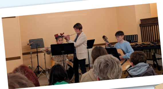
Audition école de Musique