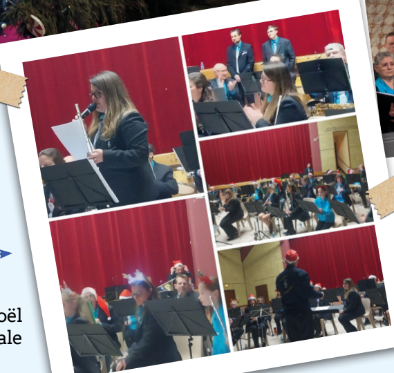
Concert de Noël Harmonie Municipale