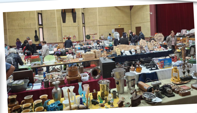
Vide grenier La Marmotte