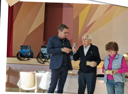
Remise de cadeaux aux doyens présents lors du repas des Sages