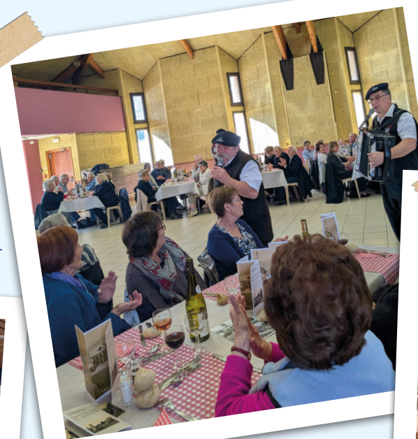
Les Vioules du Chablais au repas des Sages