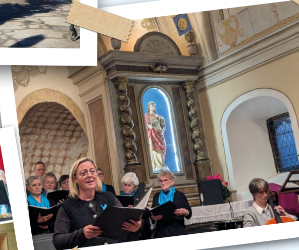
Concert de Noël Chorale Cassandrine